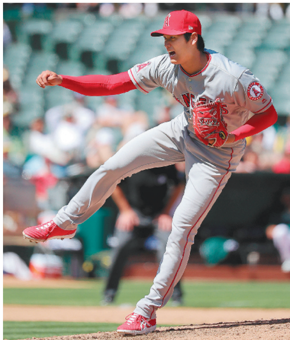
米大リーグ公式戦で初登板勝利を挙げたエンゼルスの大谷＝1日、オークランドで

投打の「二刀流」に挑む大谷は、三月二十九日のアスレチックスとの開幕戦で「八番・指名打者」としてメジャーデビュー。